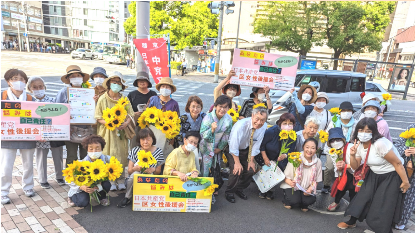
宣伝の後、記念撮影

この7月15日は、日本共産党創立101周年記念日でもあります。宵々山です。応仁の乱、一面の焼け野原