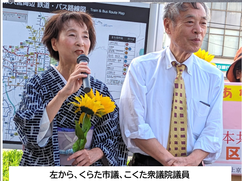
左から、くらた市議、こくた衆議院議員

大宮で京都一区日本共産党女性後援会が街頭宣伝を行ってきました。京都一区、北区、上京区、中京区、下京区、南区の女性後援会の方々