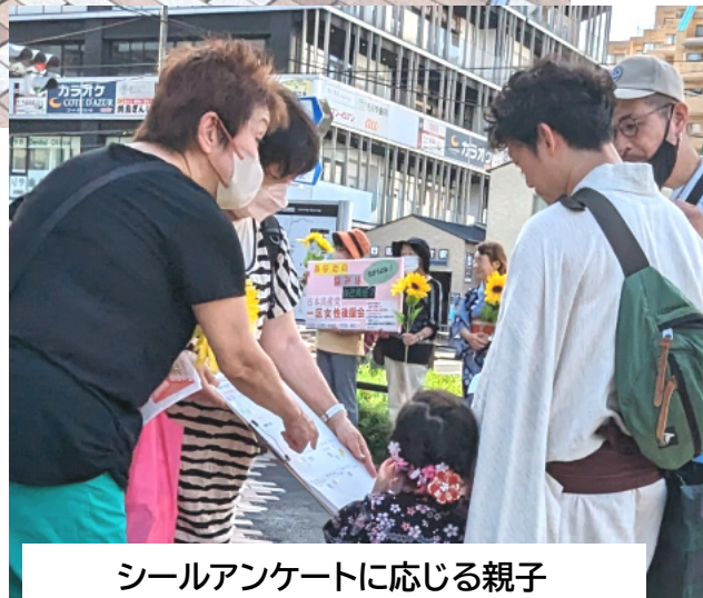
シールアンケートに応じる親子