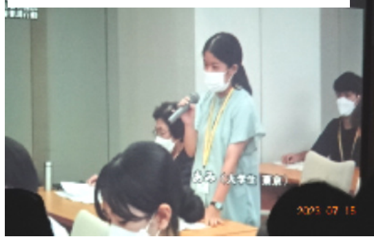
ドキュメント映画のワンシーン

憲法 café 朱八ネット (16 団体) 連絡先：京都中右京健康友の会 821-4185