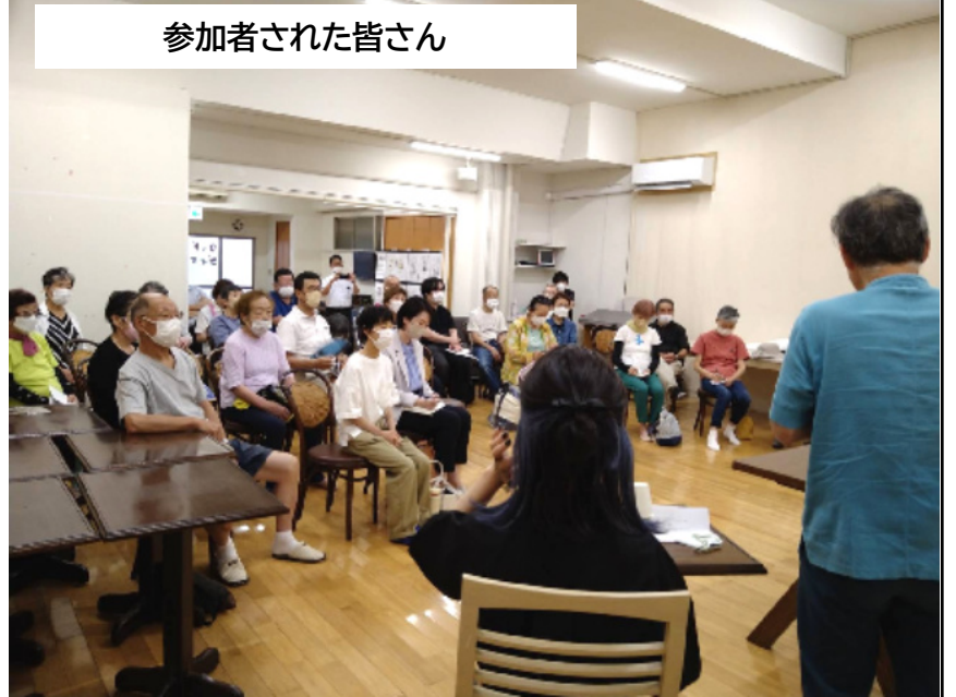
参加者された皆さん

「平和を考えるつどい」に参加しました。会場は、中京区西ノ京にある放課後等デイサービスセンターです。最初にドキュメンタリー映画が上映されました。「核兵器禁止条約に署名・批准を」と声をあげる高校生たち