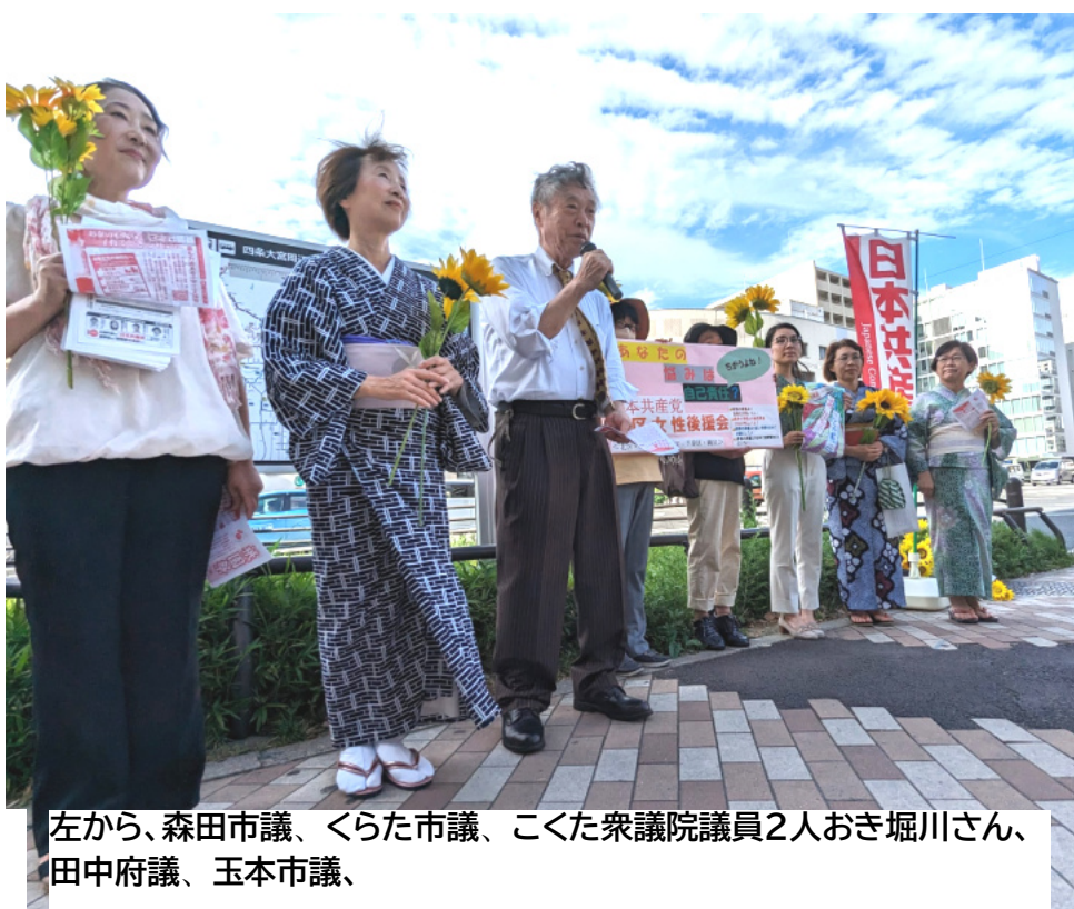
左から、森田市議、くらた市議、こくた衆議院議員2人おき堀川さん、田中府議、玉本市議、