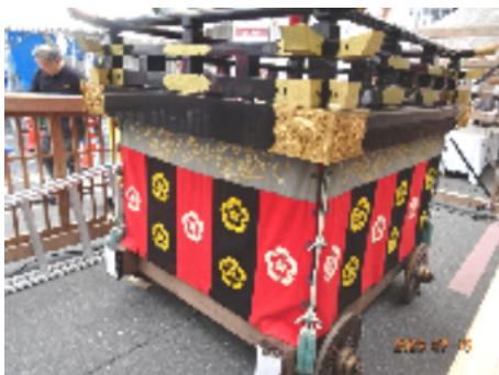
綾傘鉾 綾小路室町西入