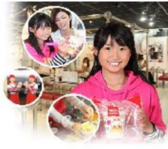
自分で作るカップラーメンを土産に持って帰ろう！