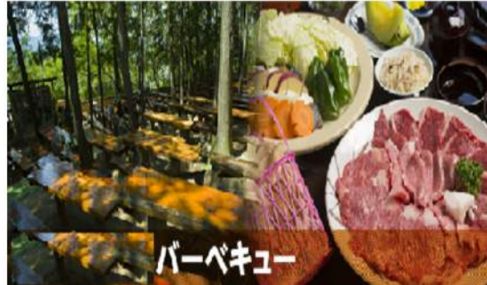
家族・仲間とわいわいがやがや楽しくバーベキュー