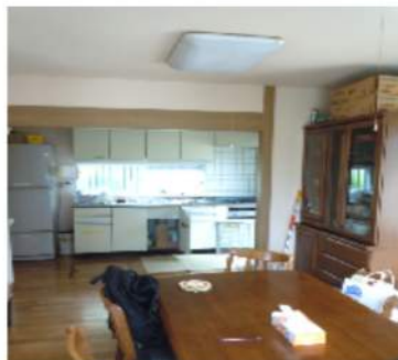
1階 リビング・キッチン