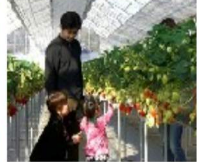
デザートはイチゴとって食べて持って帰ろう！

インスタントラーメン発明記念館 http://www.instantramen-museum.jp