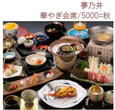
夢乃井 華やぎ会席/5000=秋