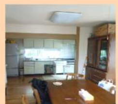
1階 リビング・キッチン