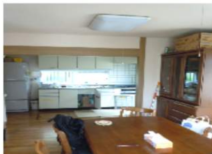
1階 リビング・キッチン