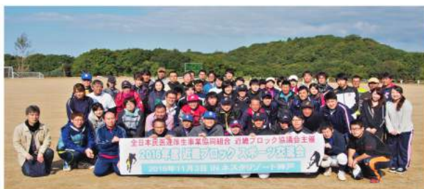
(ネスタリゾート神戸会場)

11月3日(水・祝)厚生事業協近畿ブロックスポーツ交流会が兵庫県にて開催されました。今回は、屋外競技を、ネスタリゾート・KOBЕ(旧グリーンピア三木以下略)で、屋内競技は神戸市内の「たちばな研修センター」と2か所に分かれて開催となり、全体で、家族を含め114名が参加しました。