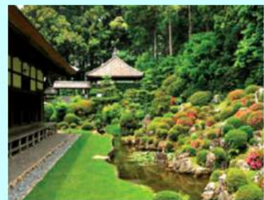
井伊家の菩提寺 龍潭寺

京都駅八条ロアバンティ前 出発 8:30 浜松(うなぎ藤田での昼食) 11:30~12:30 龍潭寺(拝観) 13:00~13:50 大河ドラマ館 14:00~15:00 休憩&土産 ⇒ 京都駅アバンティ前着 18:00頃