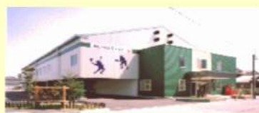
スーパーインドア外観

未経験者～上級者？まで幅広く、少し身体を動かしたい、テニスをしてみたい、久しぶりにラリーをしたい等々、いろんな要求が叶う気軽なサークルです。