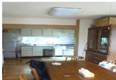
1階 リビング・キッチン