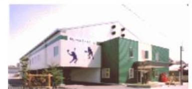
スーパーインドア外観