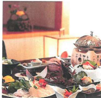
(画像はイメージです。)

募集人員 京都 25 兵庫 20 大阪 30 奈良 25 滋賀 10 和歌山 10