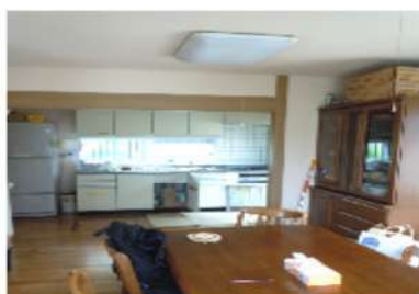
1階 リビング・キッチン